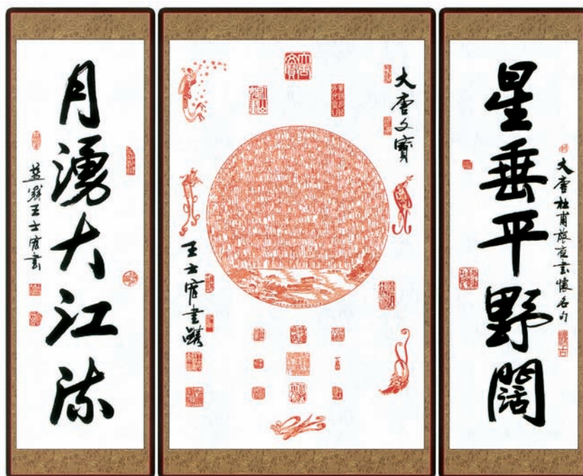
Un grand sceau ayant pour thème la lune.