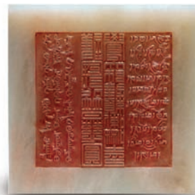
Sceau de jade en langues chinoise, tibétaine et mongole.

apprécier. A l'instar de la calligraphie chinoise, ils prennent les caractères chinois pour leurs éléments de modelage; comme la peinture chinoise à grands traits, ils adorent les expressions abstraites; et comme la poésie chinoise, ils attachent de l'importance à la création selon une belle inspiration. Finalement, leur gravure et la sculpture permettent d'obtenir un résultat tout aussi beau mais par des moyens différents. De fait, le sceau représente une forme artistique d'ensemble née de l'influence de divers