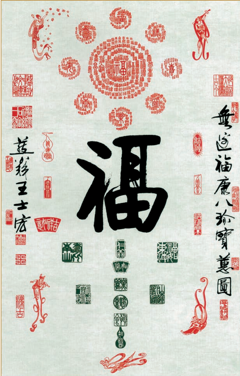
Sceau de « bonheur ».